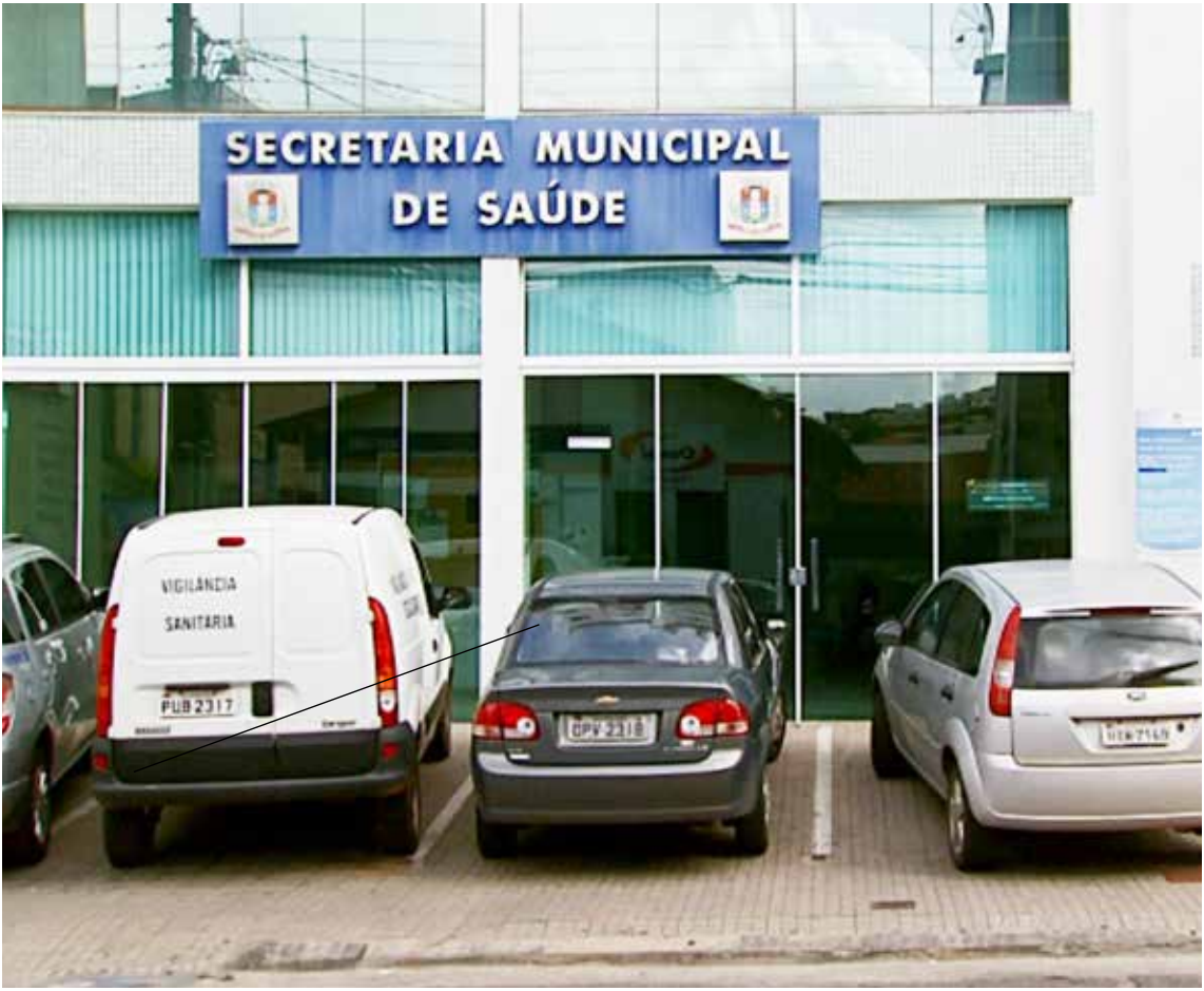
Secretaria de Saúde pode abrir processo de contratação caso se confirme afastamento dos médicos