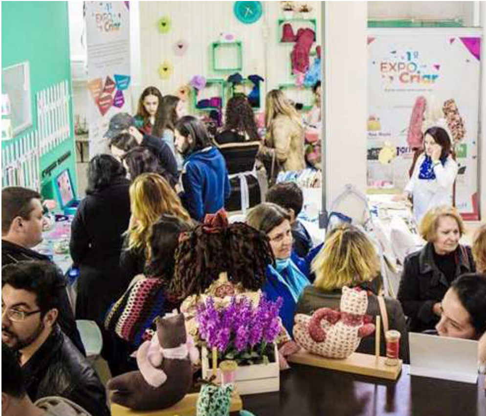
3ª edição da ExpoCriar vai reunir 41 expositores de arte, artesanato, gastronomia, oficinas e shows