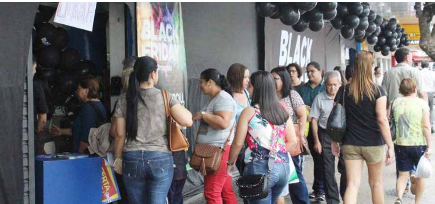
A ação promocional que marca o início da temporada de compras natalinas deve entrar pelo fim de semana

PROMOÇÕES E DESCONTOS Algumas das redes mais importantes do varejo nacional puxam a fila das promoções no shopping de Pouso Alegre. Na Riachuelo, os descontos chegam a 70% e, para quem tem o cartão exclusivo da loja, compras acima de R$ 150 podem ser parceladas em até 10 vezes sem juros. Na Renner, os descontos também alcançam até 70%. A rede é outra que oferece condições especi-