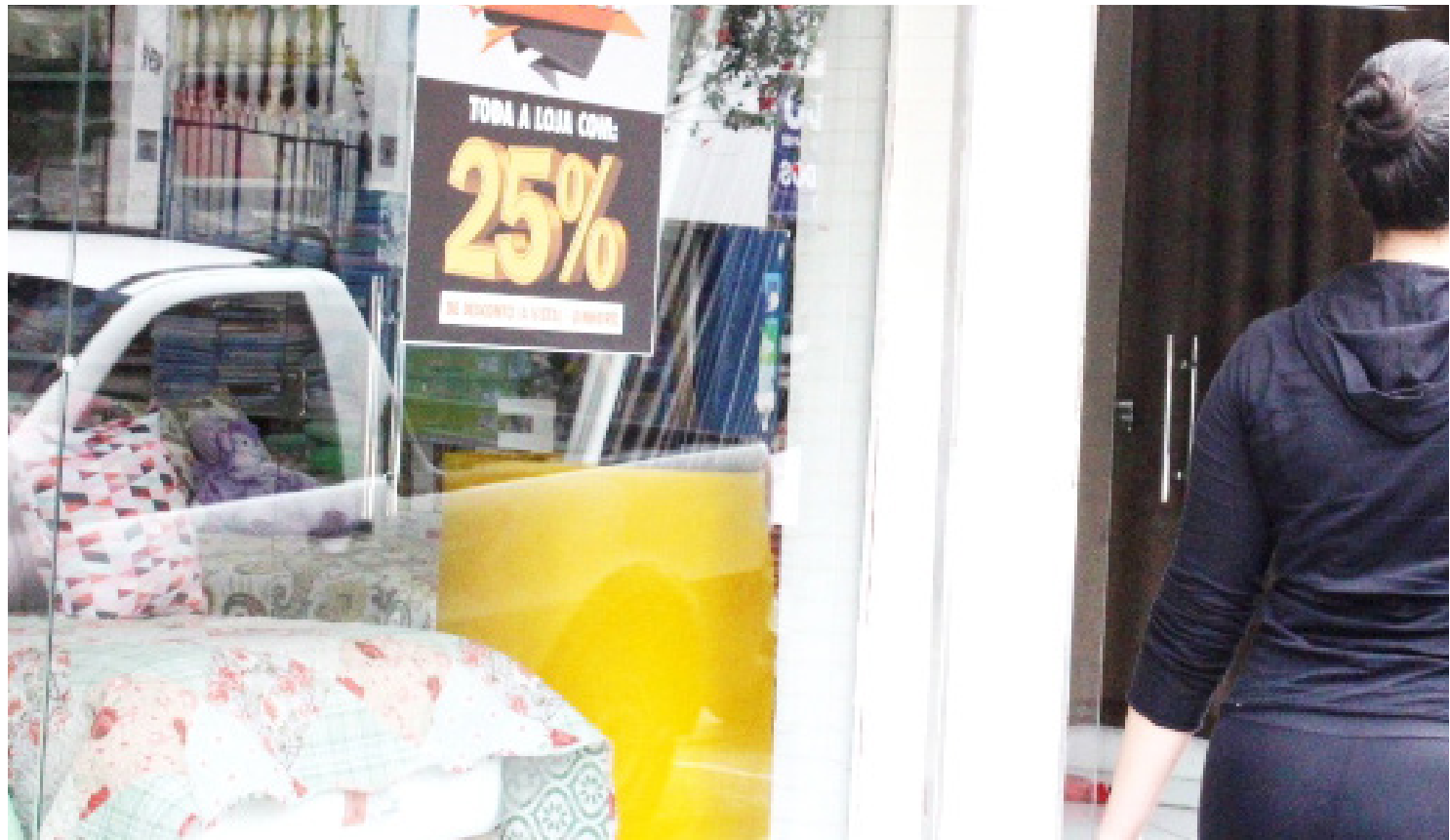
Um dos objetivos da Campanha de recuperação de crédito é a reabilitação dos consumidores para compras de fim de ano

Da redação jornaldoestado@gmail.com Uma grande campanha de recuperação de crédito em Pouso Alegre